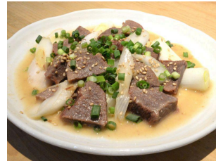
スタミナたん 1430円(税込)