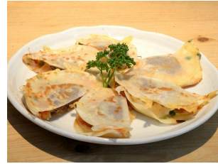
かもんピザ 1870円(税込)