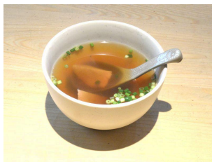
たんスープ 770円(税込)