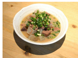
煮だたん(冬季限定) 880円(税込)