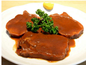
たんシチュー 1870円(税込)