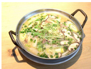
たんぞうすい 1650円(税込)